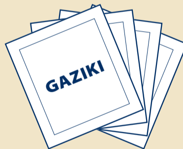
F Gaziki nasączone alkoholem (x4)