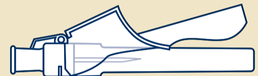
D Bezpieczna igła: 27 G*, 13 mm (1)