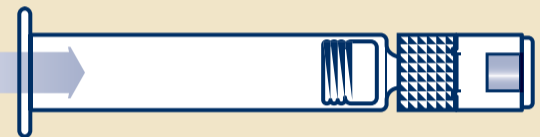
B2 Ampułkostrzykawką zawierającą jałową wodę do wstrzykiwań (1)